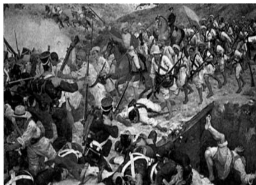
Tropas de Bolívar e de Santander que derrotaram partidários da Coroa espanhola na batalha de Boyacá