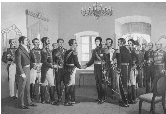
Encontro entre Simón Bolívar e José de San Martín