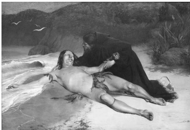
Rodolfo Amoedo. O último tamoio , 1883, óleo sobre tela, 180,3 cm x 261,3 cm, Museu Nacional de Belas Artes, Rio de Janeiro.

Darcy Ribeiro. O povo brasileiro: a formação e o sentido do Brasil . São Paulo: Companhia das Letras, 1995 (com adaptações).