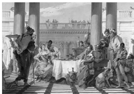
Giambattista Tiepolo. O banquete de Cleópatra , 1743, óleo sobre tela, 250,3 cm × 357 cm, Galeria Nacional de Vitória, Austrália.

Considerando o fragmento de texto e as obras reproduzidas acima, julgue os itens de 13 a 22 e faça o que se pede no item 23, que é do tipo C.