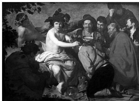
Diego Velázquez. O triunfo de Baco , 1629, óleo sobre tela, 165 cm × 225 cm, Museu do Prado, Madri.