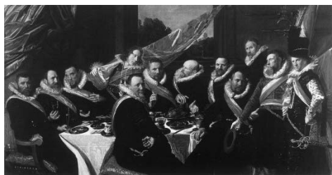
Frans Hals. O banquete dos oficiais da Milícia de São Jorge , 1627, óleo sobre tela, 179 cm × 257,5 cm, Museu Frans Hals, Amsterdã.